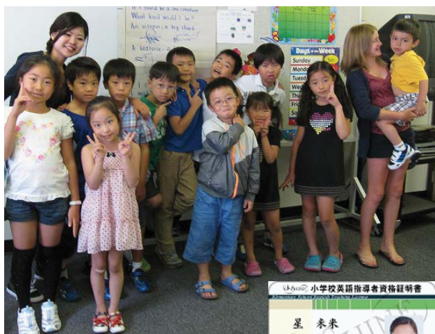
J-SHINEから与えられる資格証明書